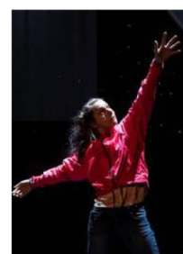
M'Pi et Jean-Louis sera proposé le 28 janvier, à la Nouvelle Scène.

Une répétition publique est prévue vendredi 14 janvier avec les élèves du collège de Nesle. La représentation sera suivie d'un temps