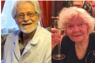
Charlotte Filou met en scène ce couple d'anciens ecclésiastiques qui ont quitté les ordres pour vivre leur amour. PAGE 6